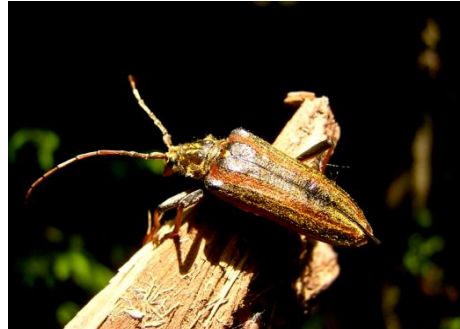
Schulterbock mit seinen langen Fühlern.