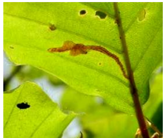
Hier ist der Buchenspringrüßler, links der Käfer, in der Mitte seine im Buchenblatt minierende Larve, oben der typische Lochfraß.