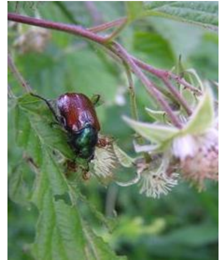
Gartenlaubkäfer sind viel kleiner als Maikäfer.