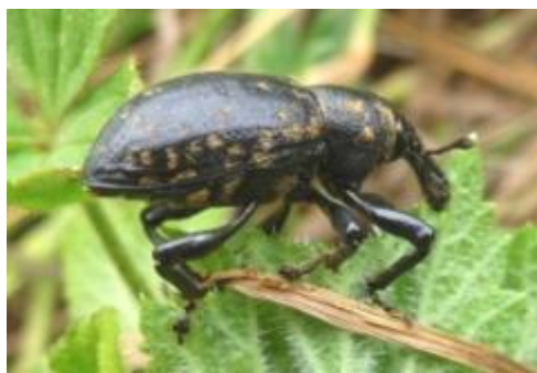
Der große Deutsche Trägrüssler lebt in unseren Wiesentälern und ist völlig harmlos.

Der interessierte Laie findet in örtlichen Buchgeschäften nur lückenhafte Bestimmungsbücher. So treten für ihn meist schon beim allerersten Käfer unüberwindliche Schwierigkeiten auf.