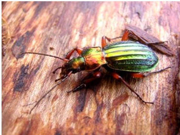
Goldglänzende Laufkäfer leben räuberisch. Laufkäfer sind besonders geschützt. Millionen von Autoreifen kann man aber nicht bestrafen.