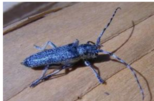
Den Namen dieses Bockkäfers bekam ich nicht heraus.