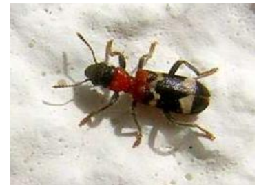
Ameisenbuntkäfer lieben Totholz, krabbeln aber auch am Forsthaus Küstelberg herum.