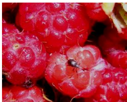
Beerenrüßler sind winzig klein Die Larven leben vom süßen Fleisch der Himbeeren.