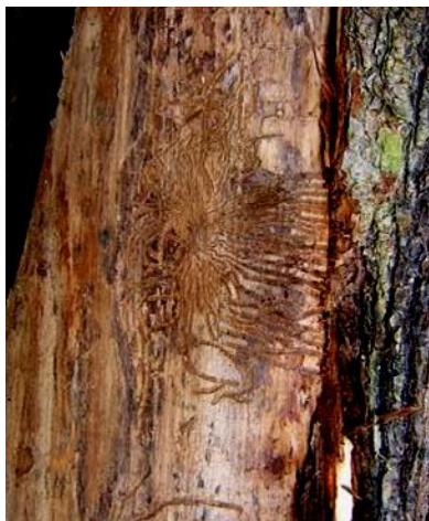
Ulmensplintkäfer (Fraßbild) verbreiten einen für Ulmen tödlichen Pilz. Sie sterben in ganz Europa.